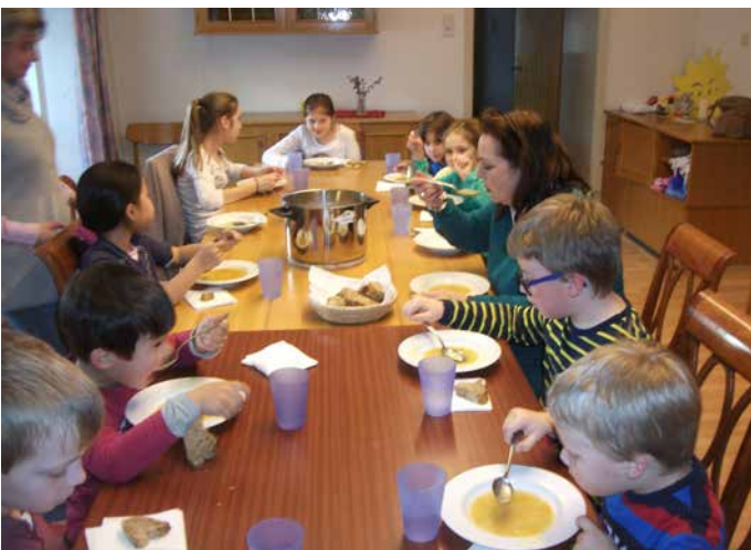
Fastensuppe – wie gut kann ein einfaches Essen schmecken; es kann den Kindern Zufriedenheit und Dankbarkeit schenken.