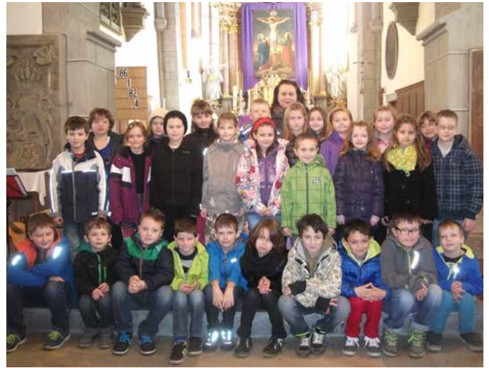
Die Erstkommunionkinder feiern einen Gottesdienst zum Thema „Wasser“, wobei jedes Kind ein Fläschchen Weihwasser mit nach Hause nimmt.