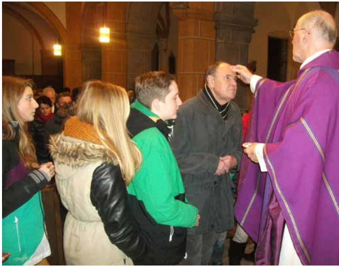
Das Aschenkreuz zum Beginn der Fastenzeit. Diese Zeit will uns neue Offenheit für das Wort Gottes schenken, aber auch Askese im konkreten Leben.