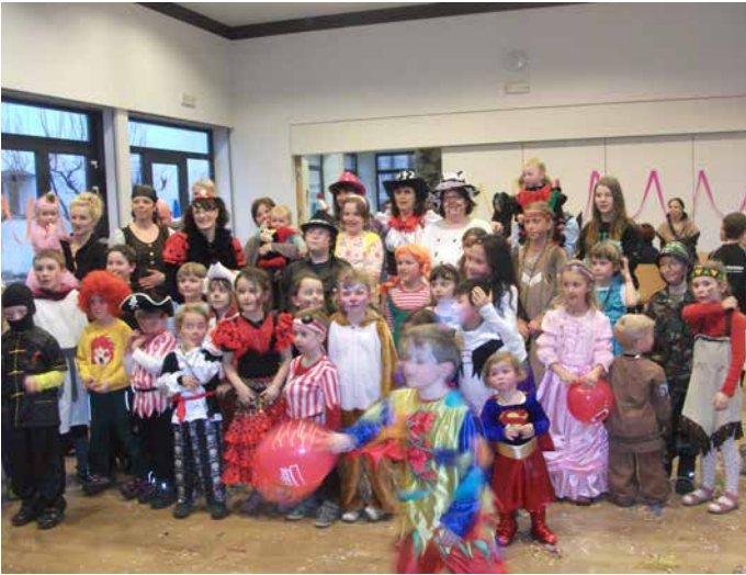
Kinderfasching – ein Blick zurück in einen verzauberten Markussaal. „Hörst du die Regenwürmer husten...“