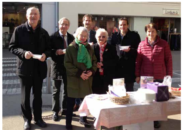
„Familienfasttag“ – unter dem Stichwort TEILEN – hier die Aktion der kfB am Offnerplatzl. Wir freuen uns über prominenten Besuch.