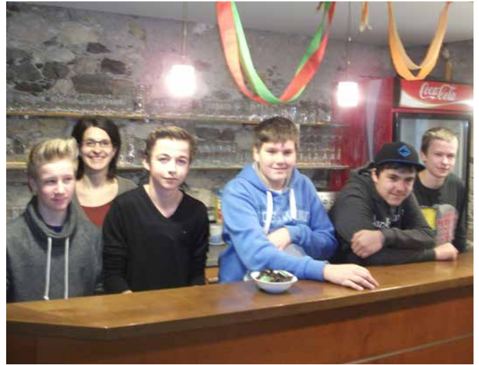
Pfarrfrühstück – Firmlinge lieben auch die praktische Mithilfe im Pfarrgesehen; hier einsatzbereit hinter der Theke.